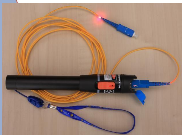
Поврежденный коннектор (излом волокна)

Детектор позволяет легко обнаруживать перегибы или обрывы волокна, дефектные соединения, сварочные стыки и другие причины потерь в радиусе до 10 км.